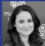
Dr. Gönül Tol Middle East Institute