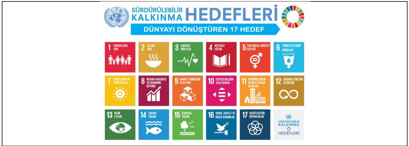
Şekil 2: BM Sürdürülebilir Kalkınma Hedefleri, https://turkiye.un.org/tr/sdgs . erişim: 30.12.2022

2015’e gelindiğinde BM Sürdürülebilir Gelişim Hedeflerini yeniden belirlemiştir ( Şekil 2 ). Kısaca “2030 Ajandası” 19 olarak tanınmaktadır. Rio’daki bağlayıcı olmayan dokümanın üzerine bağlayıcı olmaya çalışılan hedefler konmuştur. 11. hedef “Şehirleri ve insan yerleşimlerini, kapsayıcı, güvenli, esnek ve sürdürülebilir hale getirin” mottosuyla “sürdürülebilir şehir ve yaşam alanları”dır. Devamla, “2030 hedefi, güvenli ve uygun fiyatlı konutlara erişim sağlamaktır. Bu hedefe yönelik ilerlemeyi ölçmek için adlandırılan gösterge, gecekondu veya gayriresmî yerleşim yerlerinde yaşayan kentsel nüfusun oranıdır. 2000-2014 arasında, bu oran % 39’dan % 30’a düşmüştür. Bununla birlikte, gecekonduya yaşayan mutlak insan sayısı 2000-2014 yılları arasında 792 milyondan yaklaşık 880 milyona çıkmıştır. Nüfus artmış, kırsal alanlardan daha iyi konut alternatifleri mevcut olan kentsel alanlara doğru hareketler hızlanmıştır” denilmiştir.